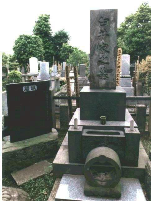
és Usui sensei sírja

Számos tapasztalattal gazdagodva és energiákkal feltöltődve bízunk abban, hogy látogatásunk hozzá fog járulni a hazai reiki, és a reiki gyakorlók fejlődéséhez, a reiki kezeléseket igénybe vevők gyógyulásához – és talán kicsit egész hazánk szellemi arculatának formálódásához is.