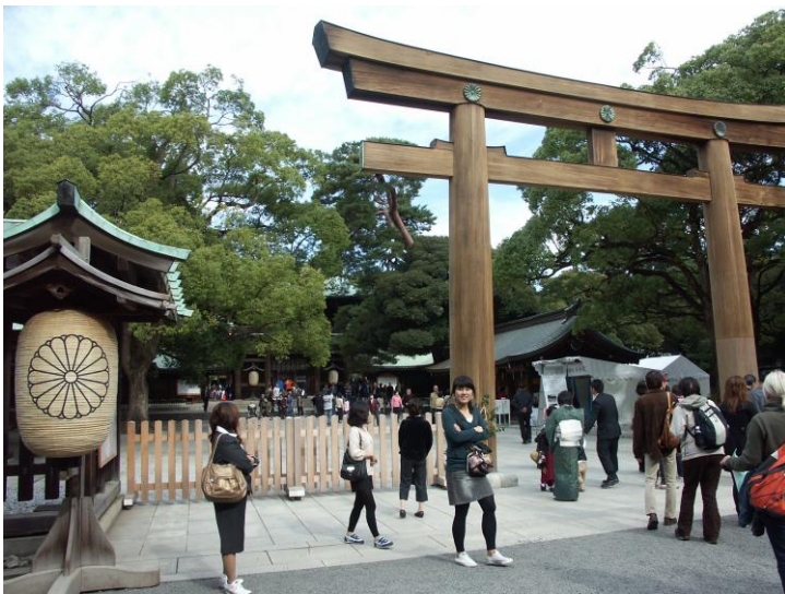
A nagy Meiji császár szentélyénél

A tanulmányút résztvevőinek alkalma nyílt a reiki szempontjából olyan fontos szent helyeket is felkeresni, mint a Kyoto melletti Kurama hegy szentélyeit, ahol Usui (és a japán szellem számos nagysága) megvilágosodott, Tokióban a Meiji császár szentélyét, vagy Usui mester sírját. Utóbbi helyen nem kis pironkodással értettük meg a sok évtizedes tartózkodást a nyugati reikisekkel való kapcsolattól: papírlapot nyomtak a kezünkbe, amelyen nagyon udvariasan megkértek, tartózkodjunk attól a zajos, udvariatlan és kegyeletsértő magatartástól, amelyet az emlékhelyet idegenforgalmi látványosságként kezelő nyugati reikisek tanúsítani szoktak. Kérésüket tiszteletben tartva sajnos így ott fényképet sem tudtunk készíteni.