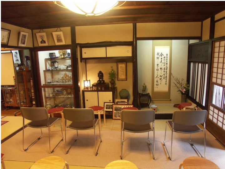
A Jikiden Reiki dojo, ahol hatvan éve tanítják a reikit