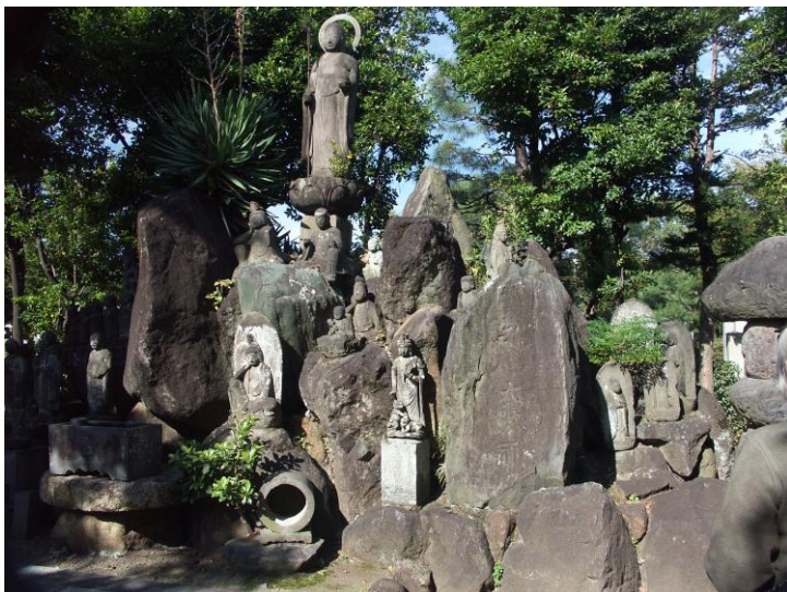
A Seihoji templom temetője