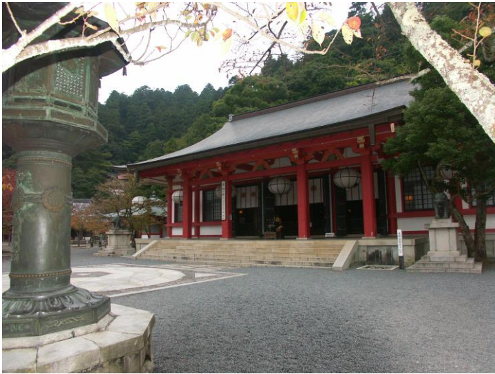
A Kurama hegy főszentélye, előtte megjelölt energiaközpont

vagy „nekem ezt a mestereim nem tanították” – és a hallgató érti a választ. A mester arról ismerszik meg, hogy a legszerényebb magatartást tanúsítja, mindenkinek megadja a kellő tiszteletet, de a tanítványok sem akarják jólérsütségüket vagy különleges képességeiket bizonygatni, ahogy ezt itthon olykor látni szoktuk. Az oktatás fegyelmezett, tisztelettudó keretek között történik, ám nincs nyoma annak a merev szertartásosságnak, amit feltételeznénk. Ahogyan a hétköznapi (átlagos, vagy éppen nagyon is jómódú) emberek is kellemes csalódást okoztak a japánokról kialakult sztereotípiákkal szemben. Arrafelé például minél gazdagabb, annál szerényebb valaki. A kötelesség elmulasztásra viszont nincs mentség, és a közösség érdeke mindig előbbre való, mint a sajátjuké.